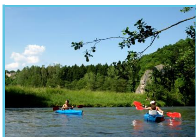
Domaine de Palogne