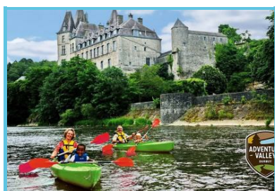
La Petite Merveille