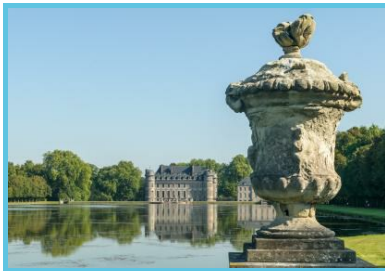
WBT - J.P. Remy