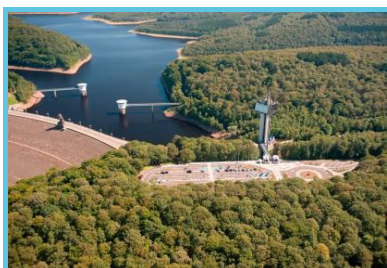
Barrage du lac de la Gileppe