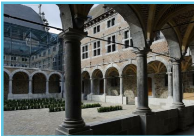
WBT - J.P. Remy