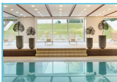
Hôtel Dolce La Hulpe Brussels