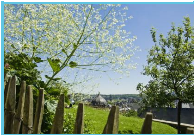
WBT - J.P. Remy