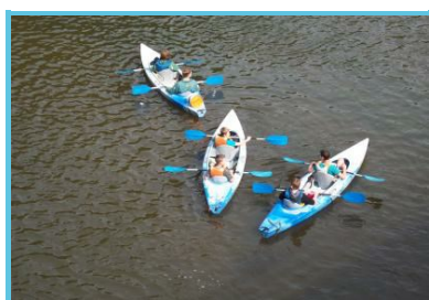
Camping l'Ami Pierre