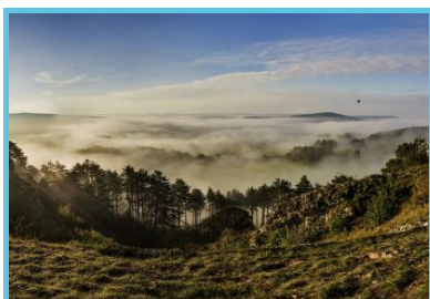
Geopark Famenne Ardenne