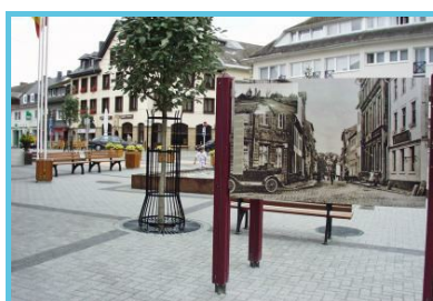
Tourist Info Sankt Vith