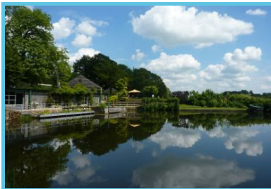
Lac de Bambois

Rue Du Grand Etang Fosses-la-ville - 5070