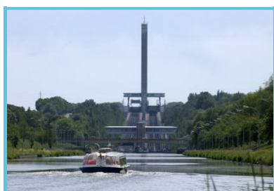
H.C.T - C.Carpentier