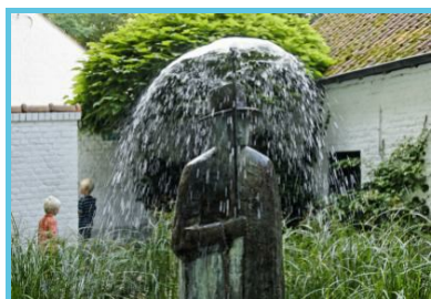
WBT - J.P. Remy