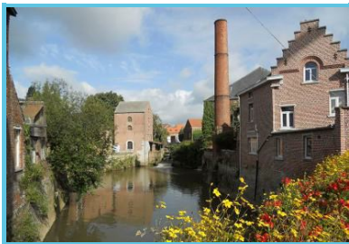
Moulins d'Arenberg - Yves-Henri Feltz