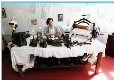
FTPL - P. Fagnoul