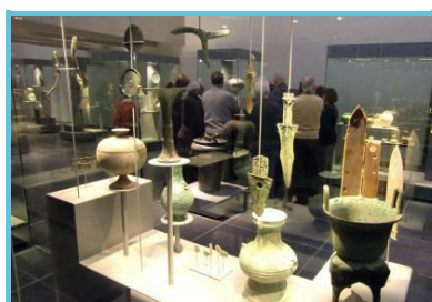
Musée royal de Mariemont

Chaussée De Mariemont 100 Morlanwez - 7140