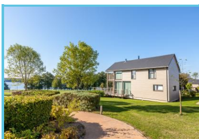
Golden Lakes Village - Lacs de l'Eau d'Heure

Route De La Plate Taille 51 Boussu-lez-walcourt - 6440