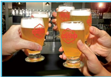
Liège Beerlovers' City