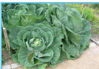
fête du chou