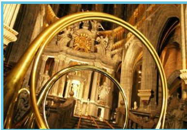
FTLB - P. Willems