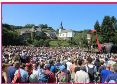
© Festival International des Arts de la Rue de Chassepierre