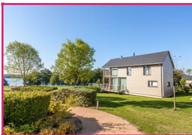
© Golden Lakes Village - Lacs de l'Eau d'Heure

Route De La Plate Taille 51 Boussu-lez-walcourt - 6440